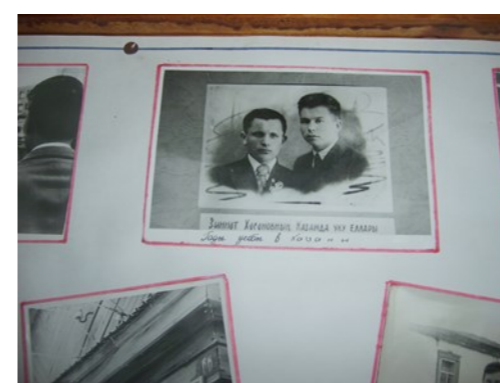
Фотостенды рассказывают о родственниках героя