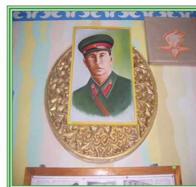
Музей встречает нас вот таким портретом нашего земляка.

На шкафах альбомы с воспоминаниями односельчан.